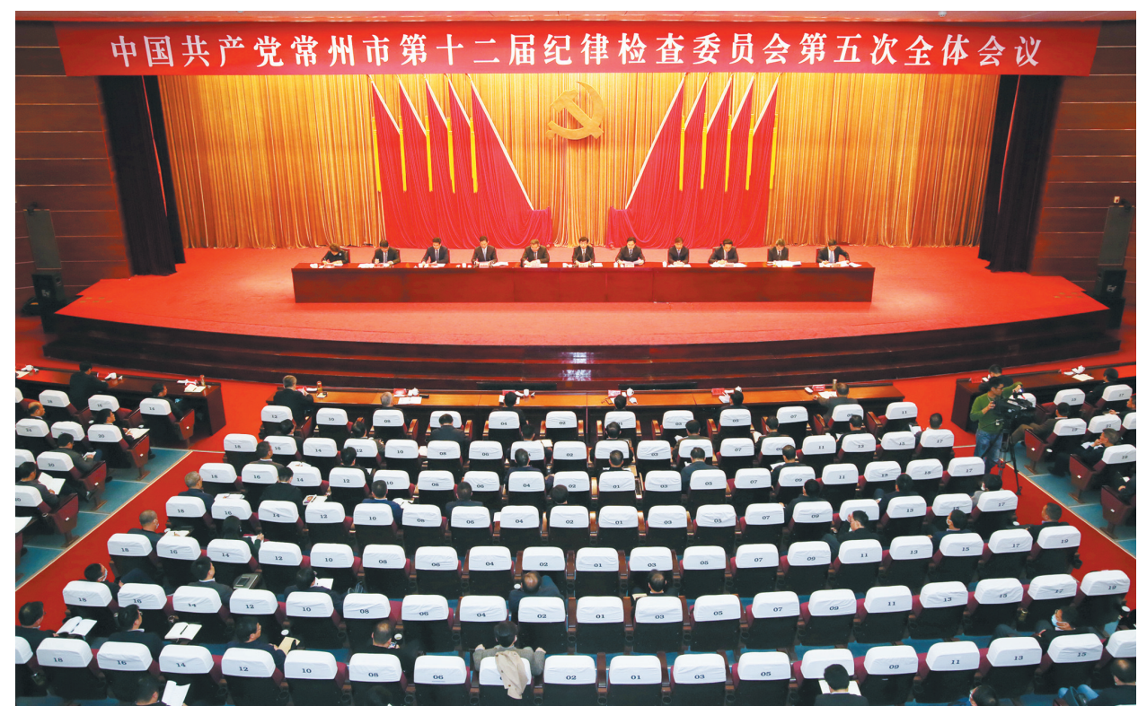
4月28日，中共常州市第十二届纪律检查委员会召开第五次全体会议。

在4月28日召开的中共常州市第十二届纪律检查委员会第五次全体会议上，市委书记齐家滨要求，全市各级纪检监察部门要认真学习贯彻习近平总书记重要讲话精神，深刻领会纵深推进全面从严治党新要求，要扛稳抓牢政治责任，为推动高质量发展走在前列提供坚强保障，要健全完善监督体系，着力推动制度优势更好转化为治理效能。 齐家滨指出，习近平总书记在十九届中央纪委四次全会上的重要讲话，深刻总结新时代全面从严治党的历史成就，对以全面从严治党新成效推进国家治理体系和治理能力现代化作出战略部署，为纵深推进全面从严治党指明了前进方向、提供了根本遵循。我们要深刻领会关于新时代全面从严治党取得历史性成就的科学总结，深刻领会坚持以“两个维护”引领全党团结统一、以科学理论引领全党理想信念的明确要求，深刻领会关于以正风肃纪反腐凝聚党心军心民心的重要经验。全市各级纪检监察机关和广大纪检监察干部要按照中央和省委的部署要求，紧密结合常州实际，坚决抓好贯彻落实。