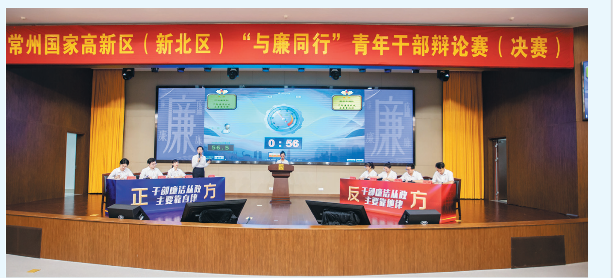
常州国家高新区(新北区)“与廉同行”青年干部辩论赛(决赛)

自今年8月以来，新北区纪委监委组织全区44家单位组成30支辩论队伍，围绕与廉同行主题开展22场廉政辩论赛，进一步强化全区党员干部廉洁意识，增强勤政廉政的责任担当。图为近日，新北区与廉同行青年干部辩论赛决赛现场。